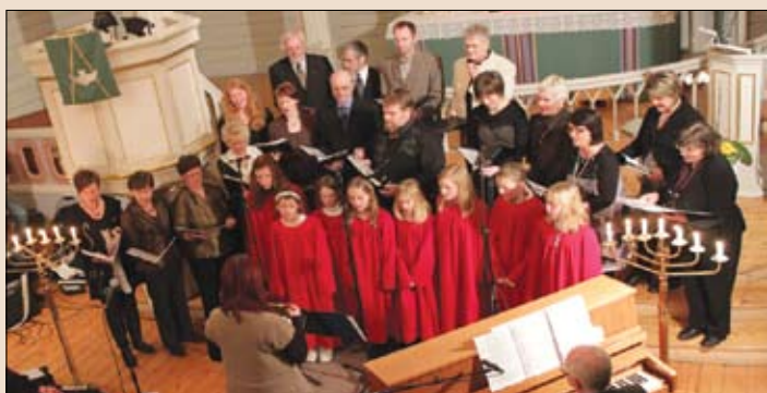
Kirkekoret, Jentekoret, blåsere. Mange gamle kjenninger. Kirkecaffe i kirkekjelleren